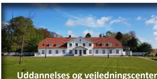
Uddannelses og vejledningscenter